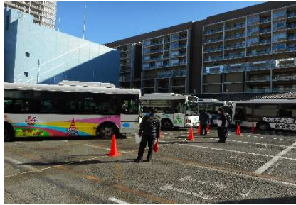
狭隘箇所での追越し 方向転換教育