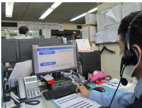
e-ラーニングの受講