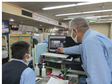
ドライブレコーダー活用指導