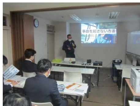
事故防止教育・指導