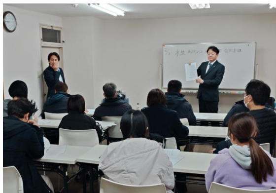
安全統括管理者による安全講習