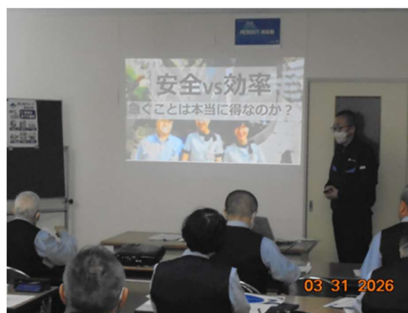
事故防止教育・指導